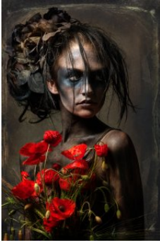
FRANZ HABERHAUER Mädchen mit Mohnblumenstrauss, 2014 Digitale Fotografie