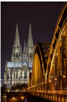
FRANZ HABERHAUER Köln, 2016 Digitale Fotografie