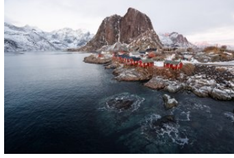
FRANZ HABERHAUER Hamnøy, 2026 Digitale Fotografie