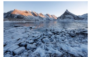
FRANZ HABERHAUER Vollandstinden, 2026 Digitale Fotografie