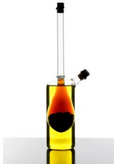
FRANZ HABERHAUER Alter Essig und Öl, 2022 Digitale Fotografie