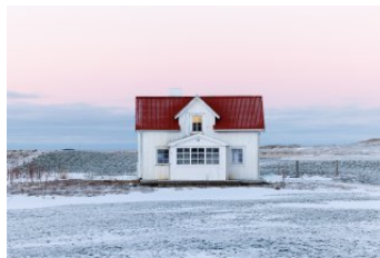
FRANZ HABERHAUER No. 43, 2026 Digitale Fotografie