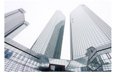
FRANZ HABERHAUER Kristallpaläste, 2024 Digitale Fotografie